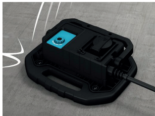
Stoßfestigkeit / shockproof: IK 07

Mit Steckdose max.230V, 8 A output with plugsocket max.230V, 8 A output Mit 2 Steckdosen max.230V, 13 A output with 2 plugsocket max.230V, 13 A output