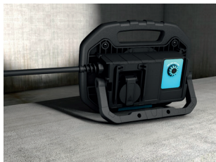
Für ideale Raumausleuchtung / for perfect room illumination