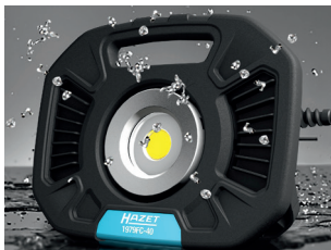
Spritzwassergeschützt / waterproof: IP54